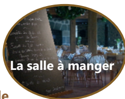
La salle à manger